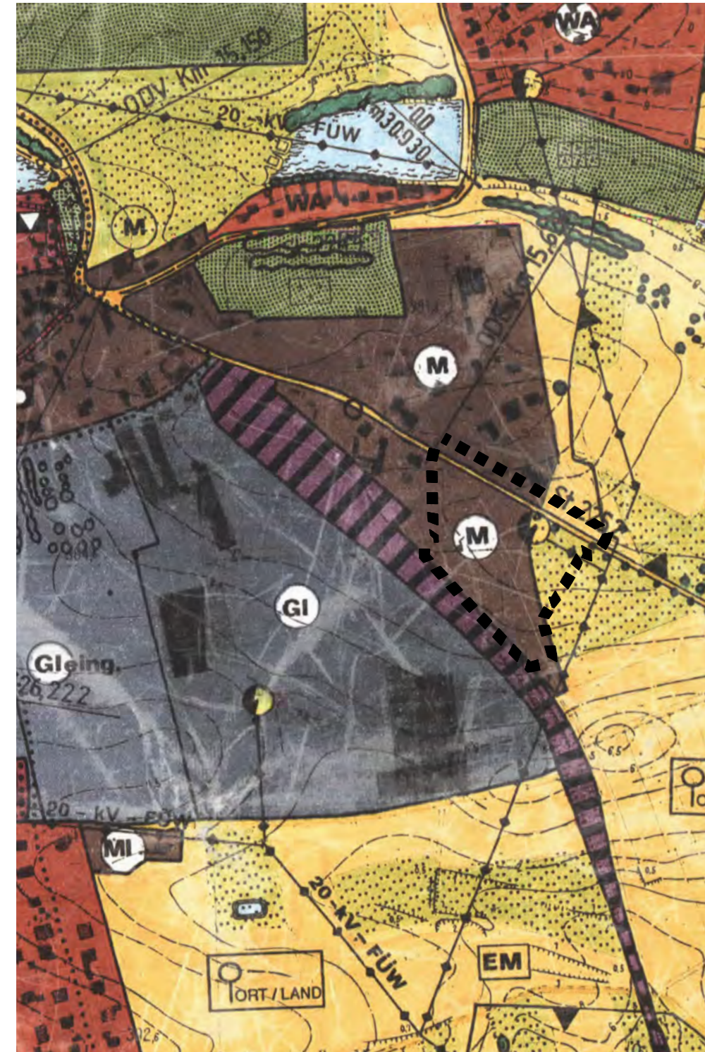
Planzeichnung Maßstab M 1:5000